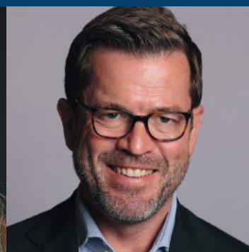
Karl-Theodor zu Guttenberg

Bestsellerautorin und promovierte Kriminalpsychologin