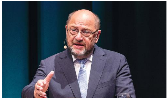
Martin Schulz wies in einer eindrucksvollen Rede auf die Bedeutung der Europäischen Union als starke Einheit hin.

Der Wert dieses Friedensprojekts ist für ihn auch ein persönlicher. Sein älterer Bruder wurde 1944 während eines Bombardements geboren, seine Mutter verbrachte mit dem Neugeborenen drei Monate in einem Keller. Schulz selbst wuchs hingegen in Frieden, Wohlstand und Freiheit auf. „Ich hatte von allem immer mehr: mehr Rechte, mehr Geld, mehr Freiheiten, mehr Freizeit, mehr Privilegien, mehr Bildung, mehr Zugang zu Infor-