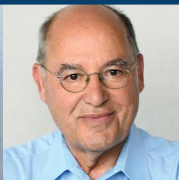
Dr. Gregor Gysi

Stellvertretende Beigeordnete NATO-Generalsekretärin a.D.